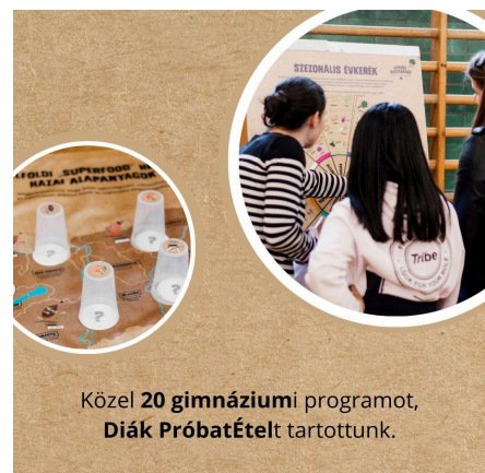
Közel 20 gimnáziumi programot, Diák Próbátételt tartottunk.

A Flex Foundation és a Flex - Hungary -nek köszönhetően az év során 10 középiskolába és nagy örömeinkre köztük több vendéglátóipari szakiskolába vihettük el a Diák Próbátétel programunkat. Fontosnak tartjuk, hogy a jövő szakácsai, vendéglátósai a szakmai ismereteiket a mi szemléletmódunkkal is kibővíthessék, szemléletformáló játék során találkozzanak a fenntartható étkezés alap fogalmaival, témaköreivel. 394 diákot értünk el, 9, 10 és 11-eseket, köszönjük a Flex Foundation támogatását!