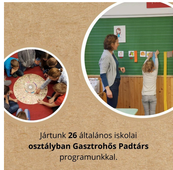
Jártunk 26 általános iskolai osztályban Gasztróhós Padtárs programunkkal.

A Kisdiófa Községi Kertben 4 alkalommal tartottunk táboros foglalkozást a VII. kerületi iskolás gyerekeknek. A fenntartható étkezés témaköréről és kertészkedésről, komposztálásról is szóló alkalmak többnyire a Kisdiófa Községi Kertben valósultak meg és az Erzsébetváros Önkormányzat Polgármesteri Hivatala támogatásával jöttek létre. Egyik alkalommal például kitzűzőket készítettünk színes textileket újrahasznosítva, tanultunk a magyar halakról, és a tojások számozásának fontosságáról. Volt zöldség-sudoku, és azt is megbeszéltük a gyerekekkel, hogy mit lehet komposztálni a kertben!