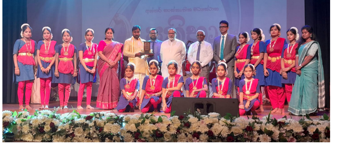
அண்மையில் கொழும்பு எஸ்பிஎன் அரங்கில் நடந்த 'பிரதீபா' தேசிய விருது வழங்கல் விழாவில் சண்டிலிப்பாய் கலாசார மத்திய நிலையம் அனைத்து கலாசார மத்திய நிலையங்களுக்குமான சமத்துவ அதிவிசேட விருதான 'அதி தூரா' விருதைப் பெற்றுக் கொண்ட தருணம்...!