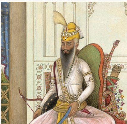
Retrato de Ranjit Singh (1830)

El 1 de marzo llegamos al célebre Fuerte de Rohtas, considerado uno de los grandes baluartes entre Tartaria y la India. Mientras serpenteábamos por los lúgubres desfiladeros y rumiábamos las diversas expediciones que habían recorrido este mismo camino, el fuerte irrumpió en nuestra vista como la escena de una linterna mágica.