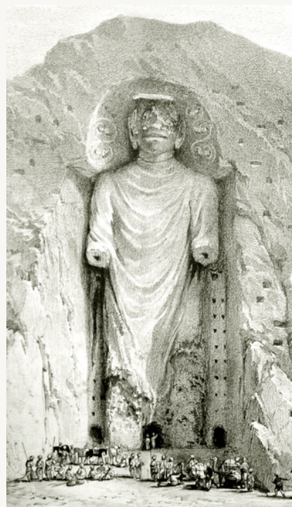
Grabado de uno de los budas de Bamiyán

“ ...debo señalar la curiosidad más notable de los ídolos de Bamiyán. Los nichos de ambos han estado en un tiempo enlucidos y ornamentados con pinturas de figuras humanas, que ahora han desaparecido de todas las partes, excepto las que está inmediatamente sobre las cabezas de los ídolos. Aquí los colores son tan vivos y las pinturas tan nítidas como en las tumbas egipcias.