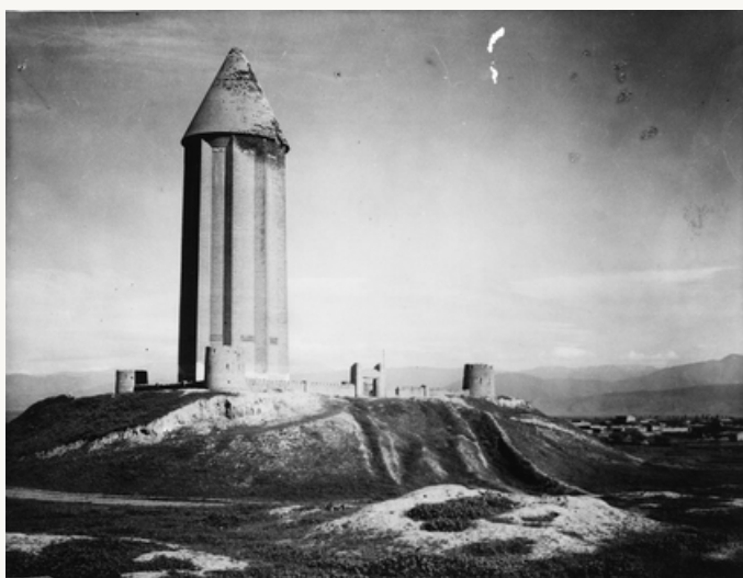
Torre de Gumbad Kabous

“ Qué largo se hace el camino en Jorasán”, dice el viajero que ha avanzado a duras penas desde el amanecer hasta casi el anochecer, y que ya no puede aferrarse a su cansado caballo más que por el pomo de su silla de montar. Uno no puede imaginarse la fatiga de una etapa de sesenta y cuatro kilómetros en Jorasán, donde hay que caminar cada paso y no hay posada ni refrigerio al final.