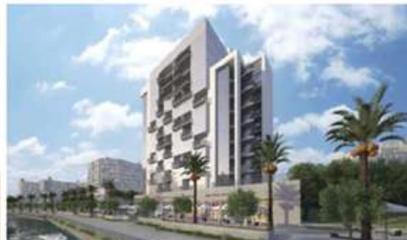
RBW5-08 AL RAHA BEACH, ABU DHABI