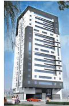
Commercial Building Sector E-4/2 Plot C-61 Abu Dhabi