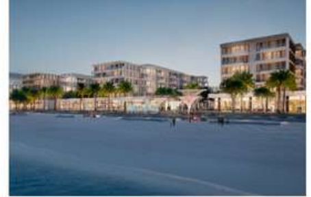
QARYAT AL HIDD DEVELOPMENT – PLOT C5 & C21