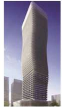
Al Ain - SEBA Tower at Khalidiyah Area