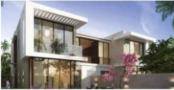
550 Villas at Akoya Park by DAMAC