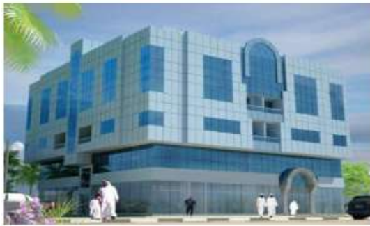
Commercial Building at Madinat Zayed