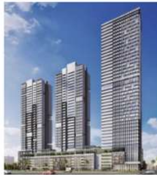
Bloom Towers, Jumeirah Village Circle, Dubai, UAE.