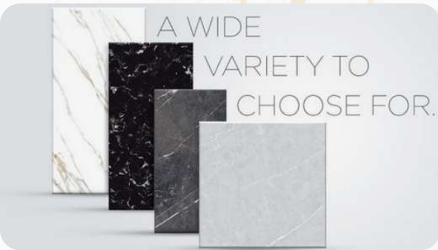
CERAMIC & PORCELAIN TILES