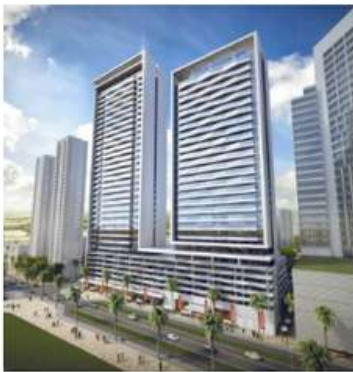
Bloom Heights, Jumeirah Village Circle, Dubai, UAE.