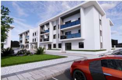
Staff Accommodation (G+2), Al Ain