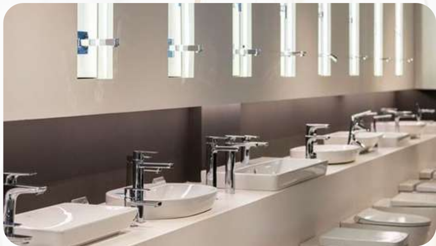
SANITARY WARE, MIXERS & BATHROOM ACCESSORIES