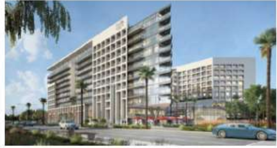
SWD4-C1 Park View Saadiyat Island, Abu Dhabi