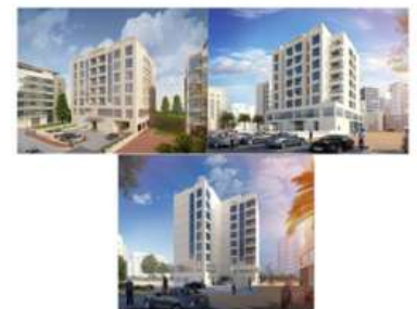
Residential Buildings on Plot No. C3, C9, C10, and C11 in Khalifa City-A, Abu Dhabi