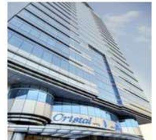
CRISTAL HOTEL – AL SALAM