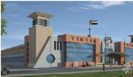
Al Noor Rehabilitation for Special Needs Center