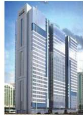
Three Offices Building