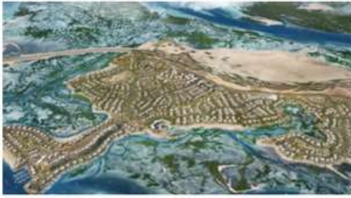
JUBAIL ISLAND – VILLAS & TOWNHOUSES - PHASE 01, 02 & 03