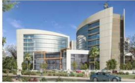
BURJEEL MEDICAL CITY at MBZ, ABU DHABI