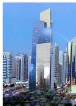
TANHOON BIN SAEED TOWER