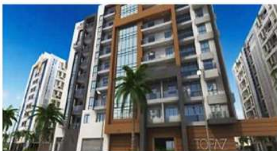
RESIDENTIAL BUILDINGS – TOPAZ AT SILICON OASIS