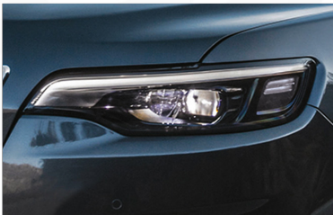
SISTEMA INTEGRAL DE LUCES LED