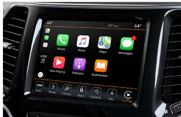
PANTALLA TÁCTIL 7.0" CON SISTEMA CAR PLAY