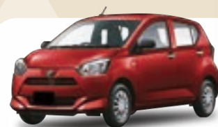
ダイハツ ミライース L 月額 / 9年定額108回払

頭金0円・ボーナス払0円 / 月間走行距離1,000km の場合 ※設定残存価格を除き、表示価格は税込です。