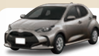
トヨタ ヤリス X 月額 / 7年定額84回払