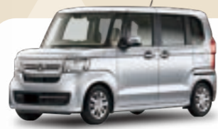
ホンダ N-BOX G 月額 / 9年定額108回払