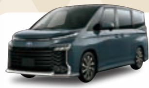
トヨタ ヴォクシー S-G7乗車 月額 / 5年定額60回払