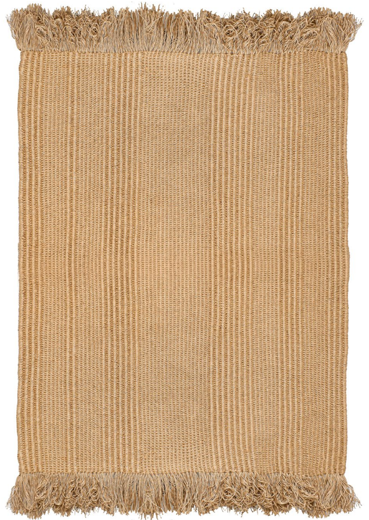
06 dimensionet | € 435 masa | dimensions: 135x165cm fibra | weight: 11.5kg | fiber: 100% lin | 100% flax