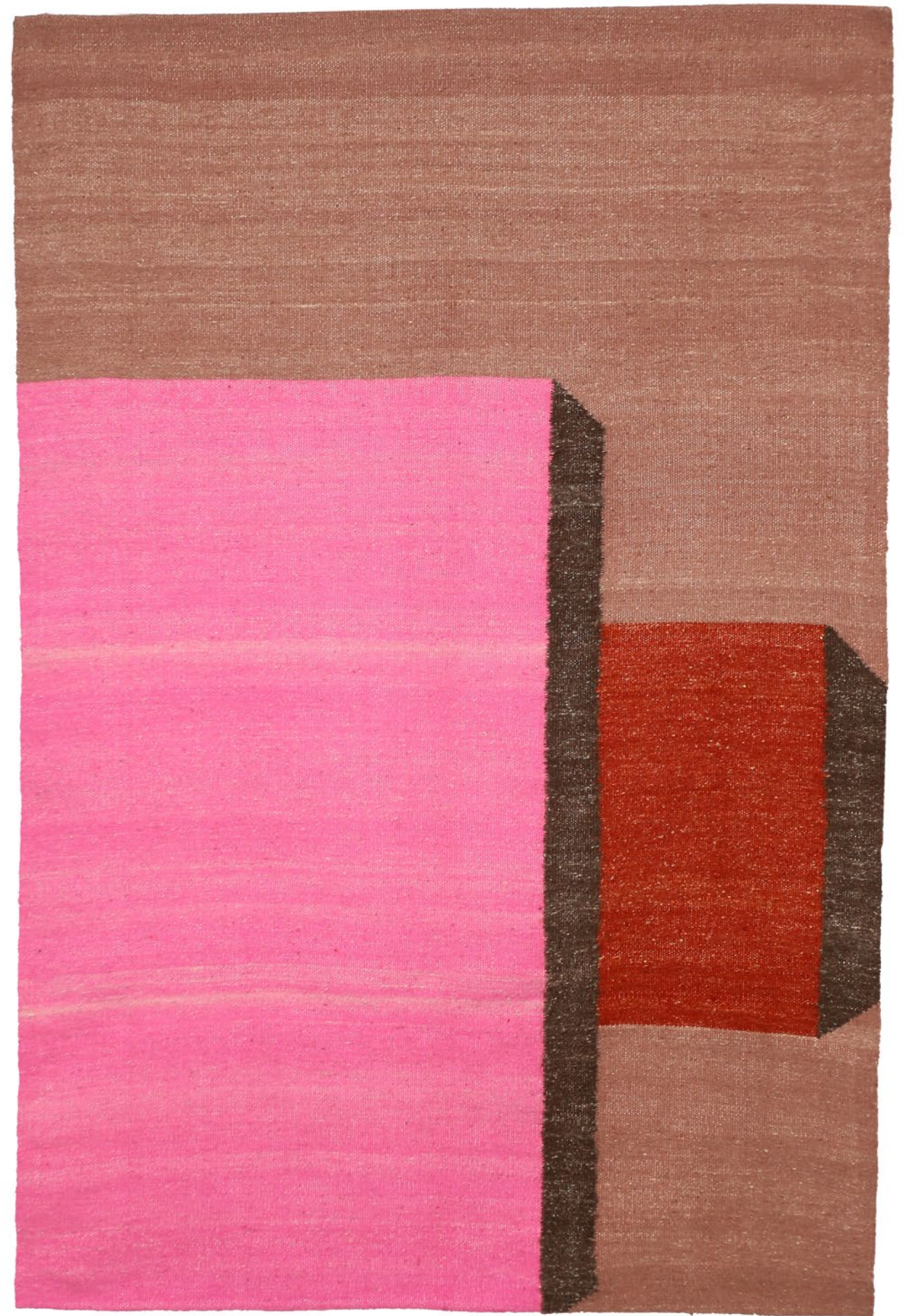
04 dimensionet | € 365 masa | dimensions: 120X180cm fibra | weight: 1.9kg lesh dele shqiptare | fiber: lesh dele shqiptare | Albanian sheep's wool