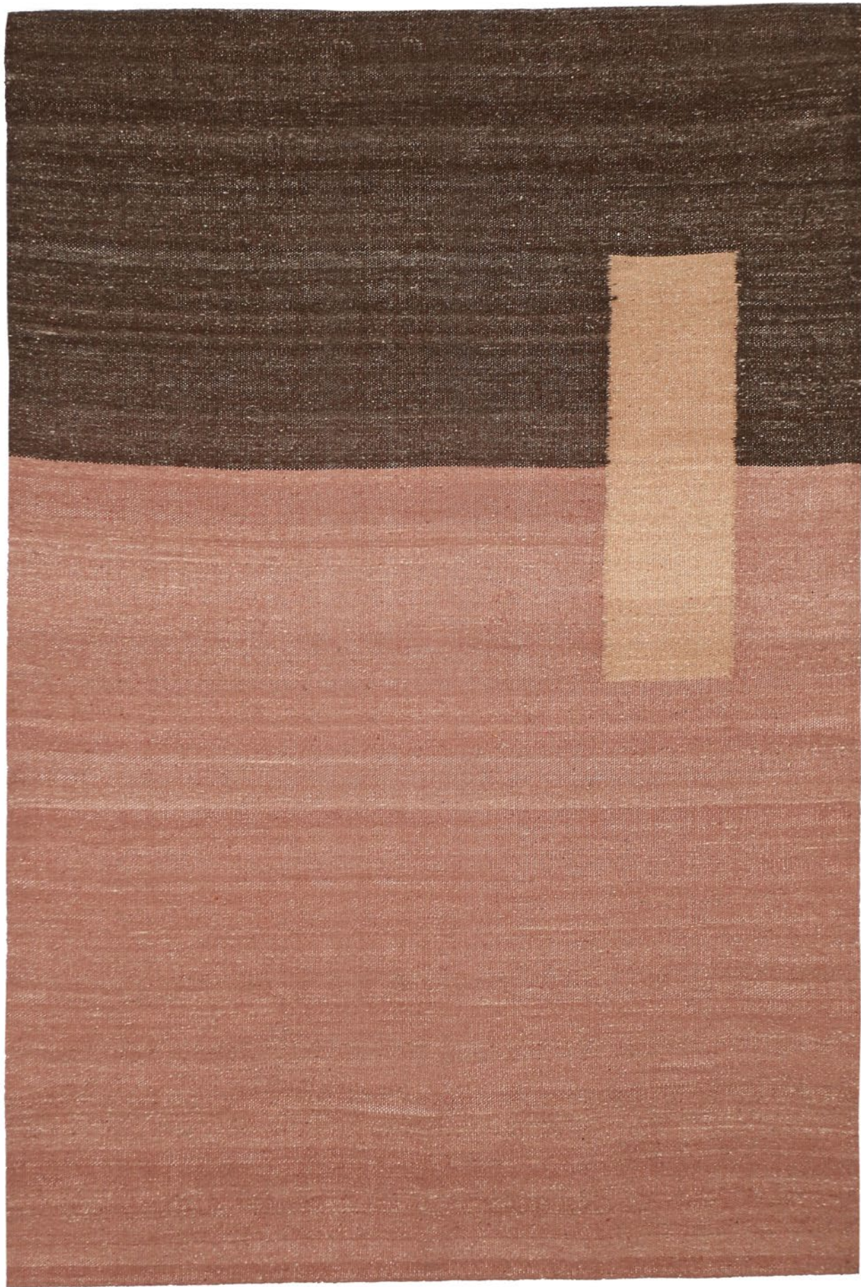
01 | € 365 dimensionet | dimensions: 120X180cm masa | weight: 1.9kg fibra | fiber: lesh dele shqiptare | Albanian sheep's wool