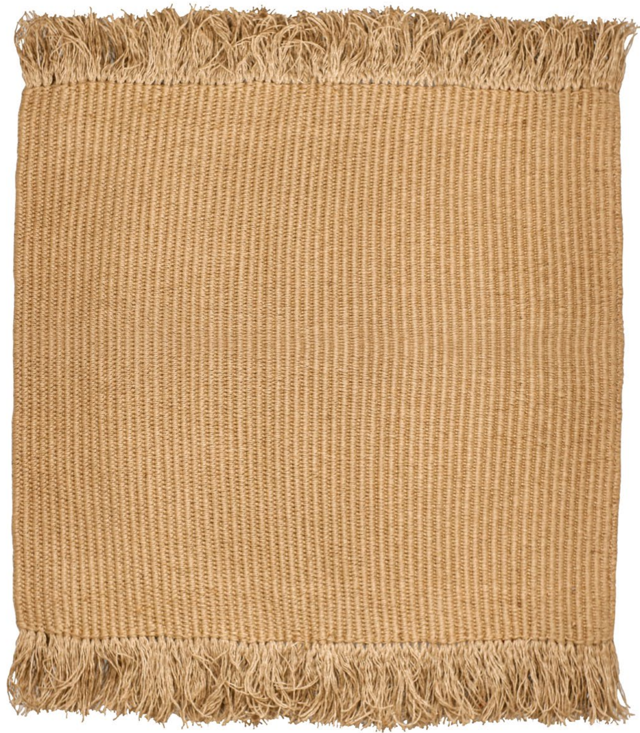
07 dimensionet | € 330 masa | dimensions: 125x125cm fibra | weight: 10.0kg | fiber: 100% lin | 100% flax