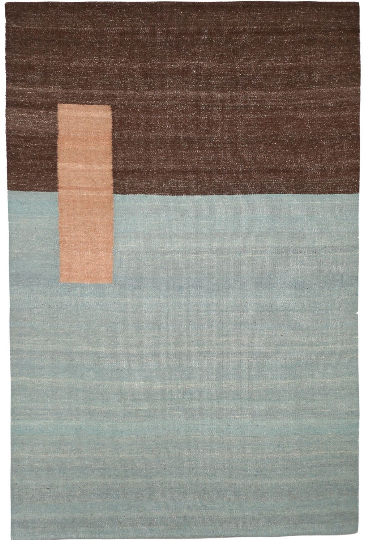
02 | € 365 dimensionet | dimensions: 120X180cm masa | weight: 1.9kg fibra | fiber: lesh dele shqiptare | Albanian sheep's wool