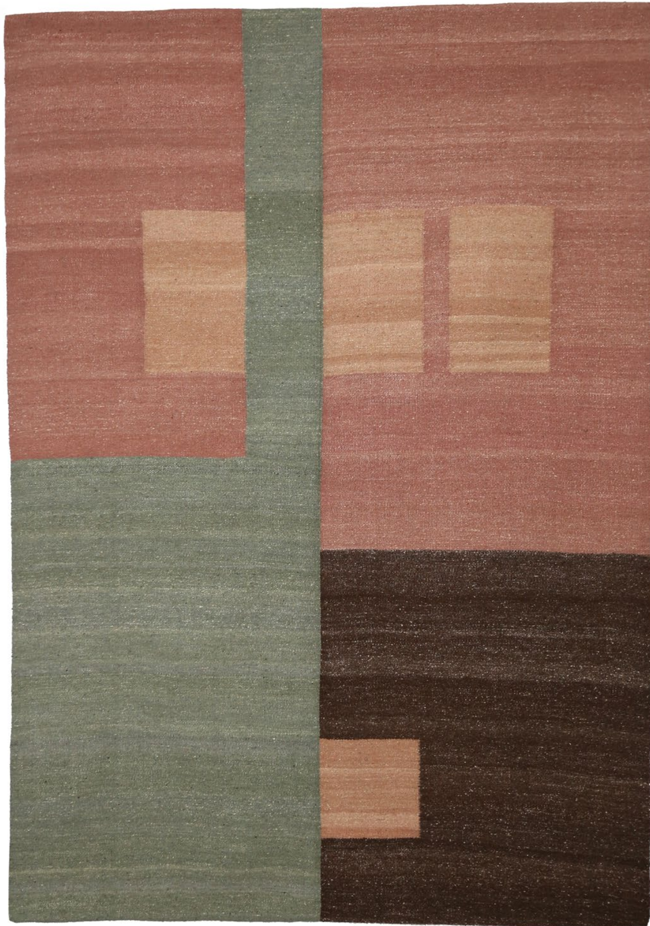
03 dimensionet | € 510/ € 950 masa | dimensions: 150X215cm/185X260cm fibra | weight: 2.8kg/5.0kg lesh dele shqiptare | fiber: lesh dele shqiptare | Albanian sheep's wool