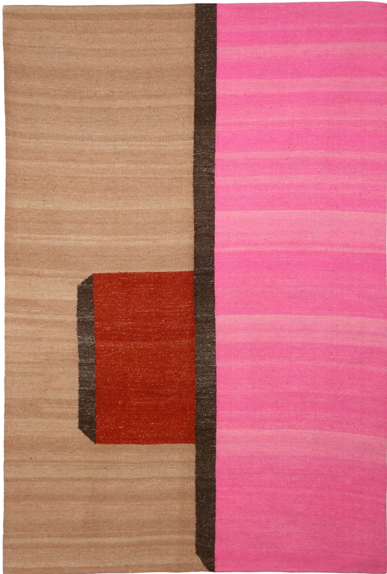
06 | € 560/ € 1020 dimensionet | dimensions: 150X200cm/200x300cm masa | weight: 3.3kg/5.4kg fibra | fiber: lesh dele shqiptare | Albanian sheep's wool