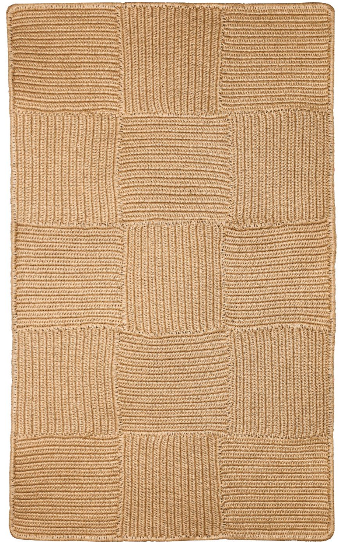
08 dimensionet | € 515 masa | dimensions: 120x205cm fibra | weight: 3.3kg | fiber: 100% lin | 100% flax