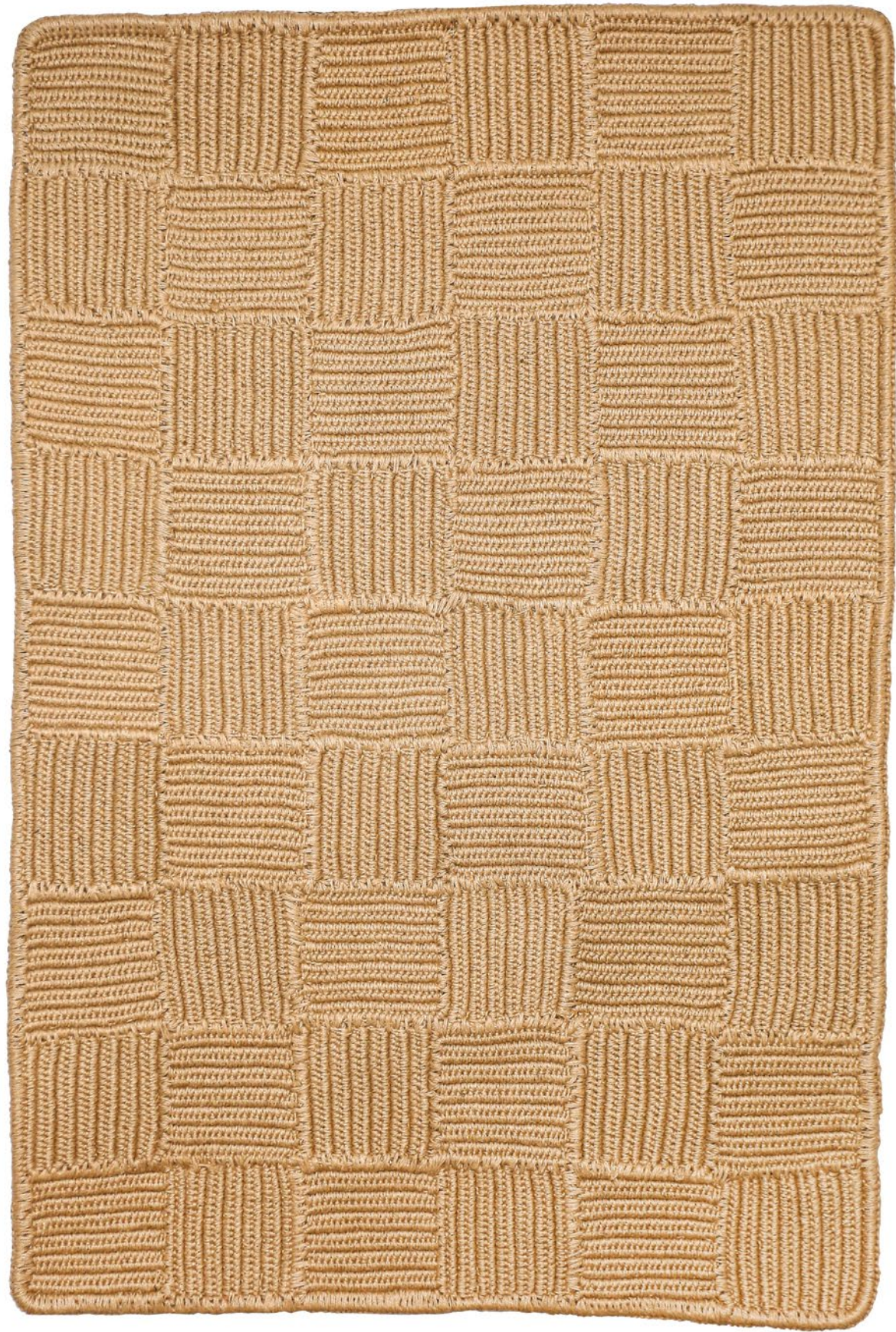
05 dimensionet | € 475 masa | dimensions: 125x180cm fibra | weight: 7.8kg | fiber: 100% lin | 100% flax