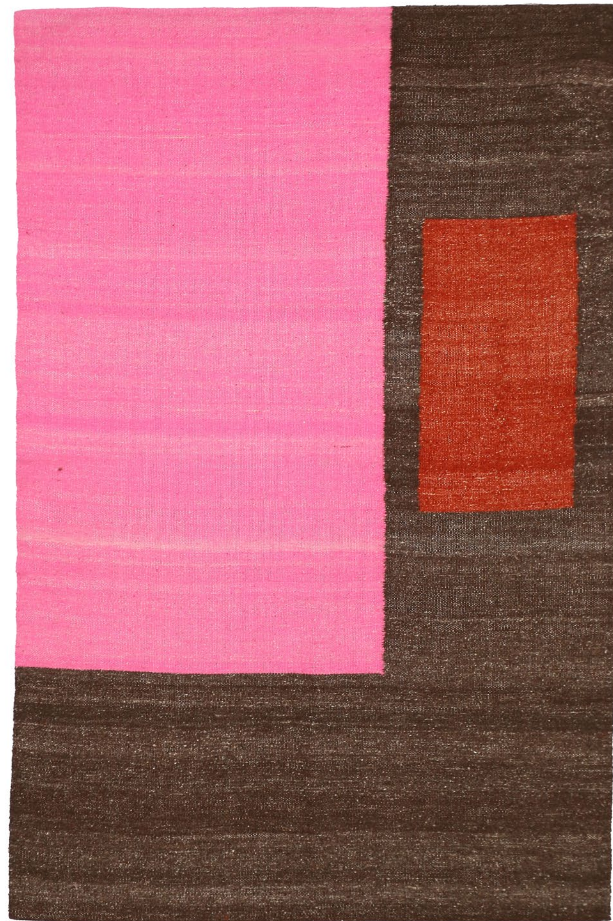
05 | € 365 dimensionet | dimensions: 120X180cm masa | weight: 1.9kg fibra | fiber: lesh dele shqiptare | Albanian sheep's wool