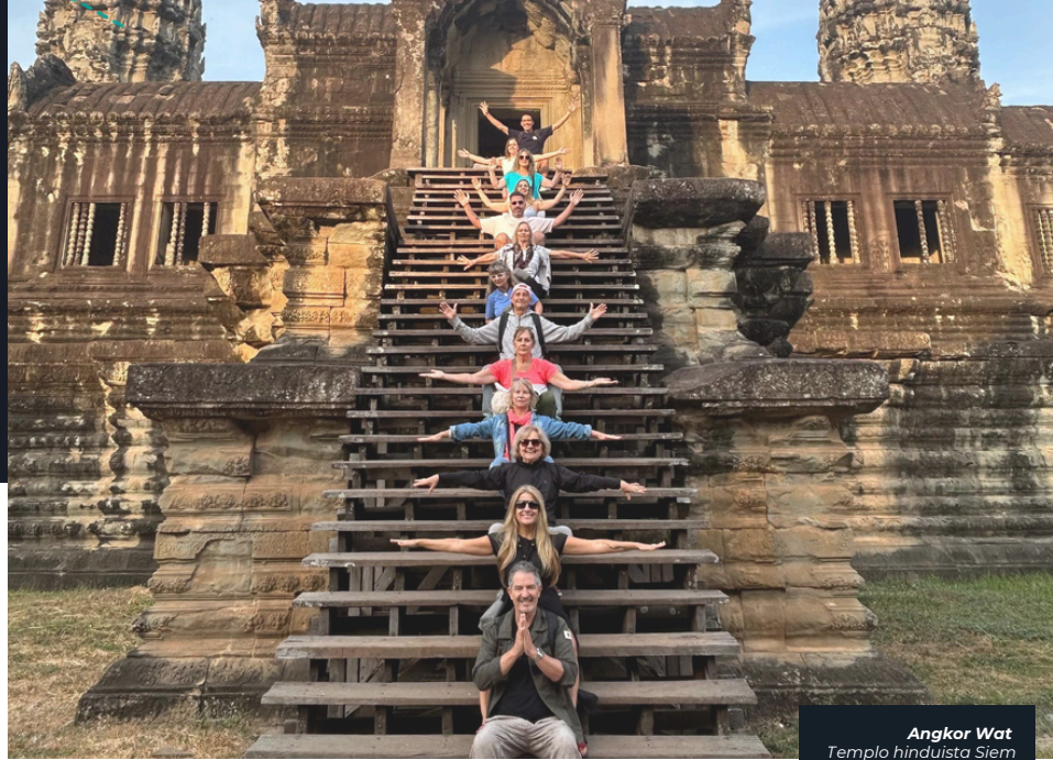
Angkor Wat Templo hinduista Siem Reap, Camboya

Viajaremos a la exclusiva isla de Koh Lipe con sus aguas cristalinas y callecitas peatonales. ¡Terminaremos el tour con la modernidad deslumbrante de Singapur! Mezcla de todas las culturas, en el barrio árabe, el barrio chino o el barrio hindú. Además, su modernidad en Gardens By the Bay que crean el entorno perfecto al icónico Marina Bay. Mucho más nos espera para despedir este viaje que llenará sus pupilas y sus corazones.