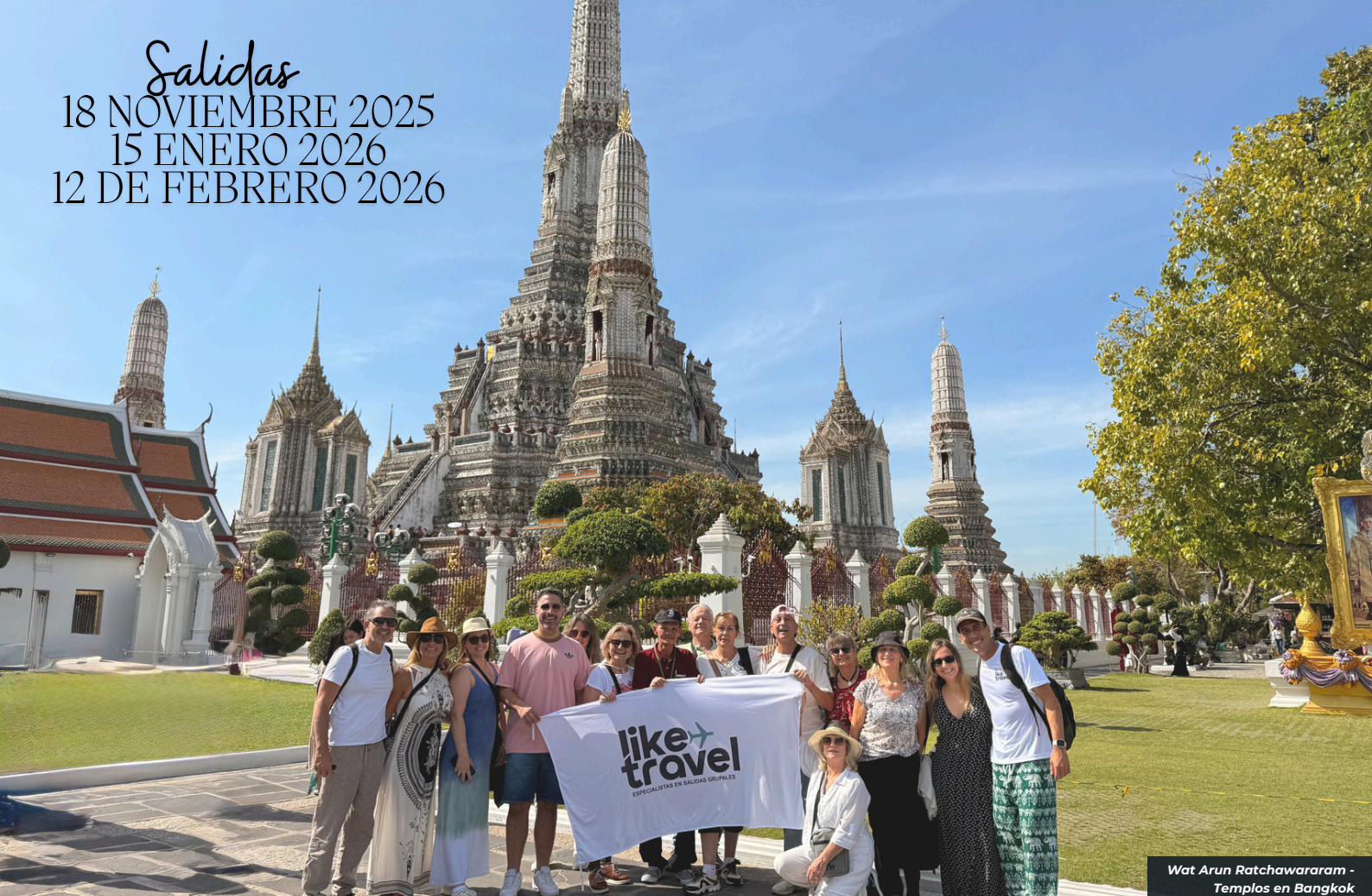
Wat Arun Ratchawararam - Templos en Bangkok

Salidas 18 NOVIEMBRE 2025 15 ENERO 2026 12 DE FEBRERO 2026