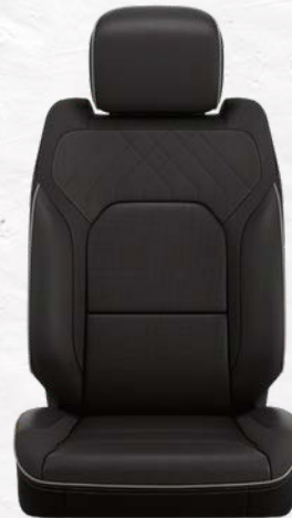
프리미엄 퀄티드 레더 버킷시트 - 블랙