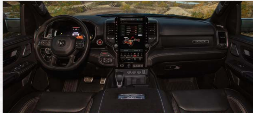
Ram 1500 RHO 스웨이드가 포함된 프리미엄 가죽 인테리어