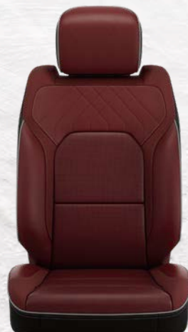
프리미엄 퀄티드 레더 버킷시트 - 에보니 레드