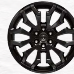
22-inch Premium Black-Painted Aluminum