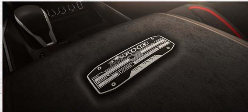
Ram 1500 RHO 전용 센터 콘솔 배지

18-inch Beadlock-Capable Aluminum Optional (WS1)