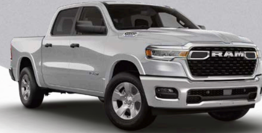
SILVER ZYNITH (PSE)