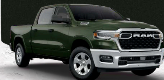
SERRANO GREEN METALLIC (PG9)