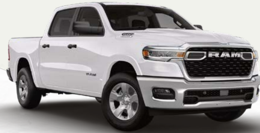
BRIGHT WHITE (PW7)