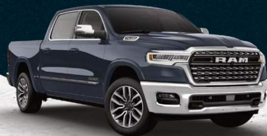
FORGED BLUE METALLIC (PCG)