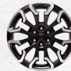
22-inch Black-Painted/Polished Aluminum