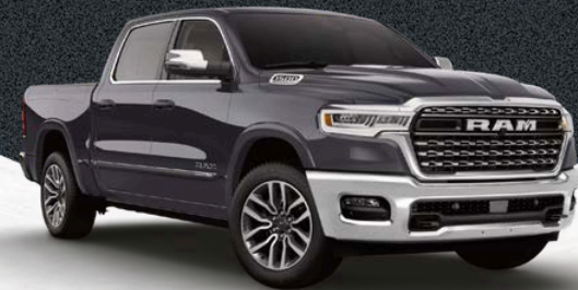
GRANITE CRYSTAL METALLIC (PAU)