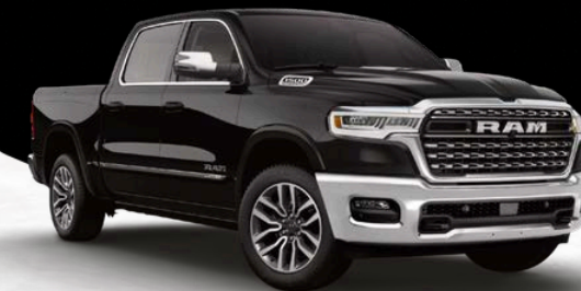
DIAMOND BLACK CRYSTAL PEARL (PXJ)