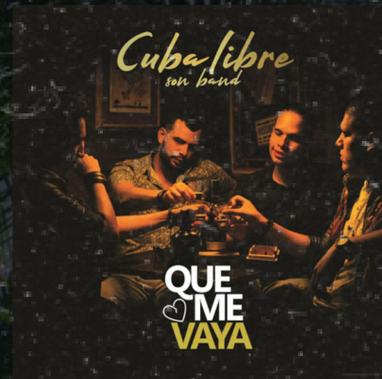
Que me vaya