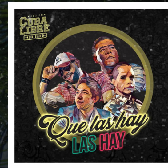
Que las hay las hay