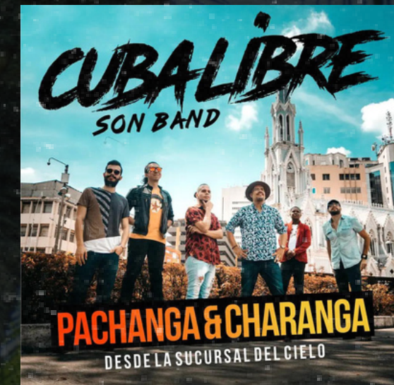
Pachanga y charanga