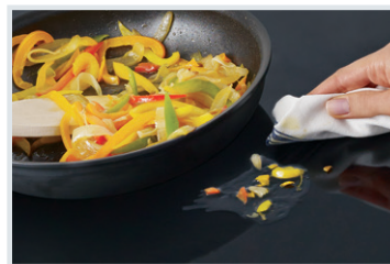
Table de cuisson à induction

Un ventilateur et un troisième élément chauffant font circuler uniformément la chaleur pour une cuisson sur plusieurs grilles plus rapide et plus uniforme.