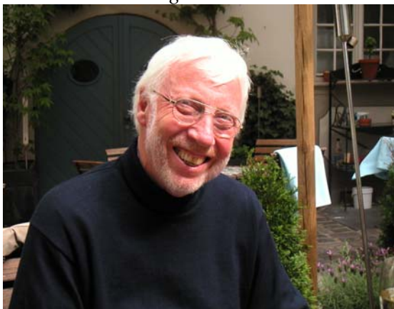
Und die andere trinken überhaupt nicht!