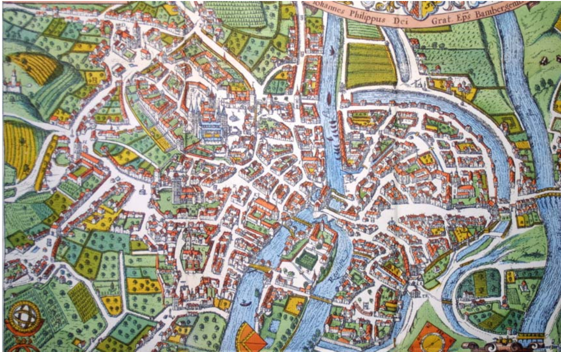
Altstadt von Bamberg

Mit ICE und Regionalzug nach Bamberg, Altstadt Bamberg, Domplatz, Historischer Abriss der Geschichte von Bamberg, Rathausplatz, Obere Sandstrasse