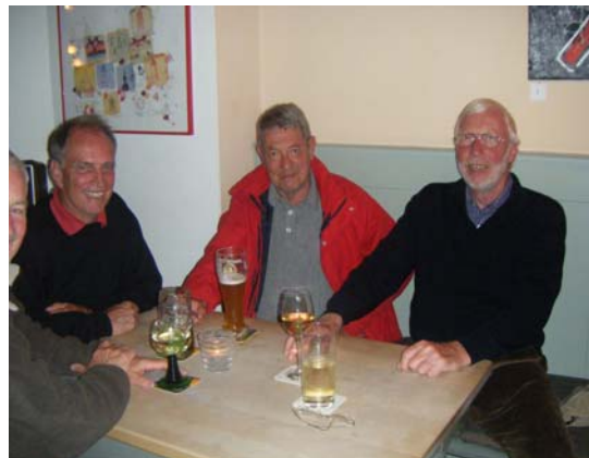
Es braucht zwei Photos in der Fischerei für den vollständigen MZIG