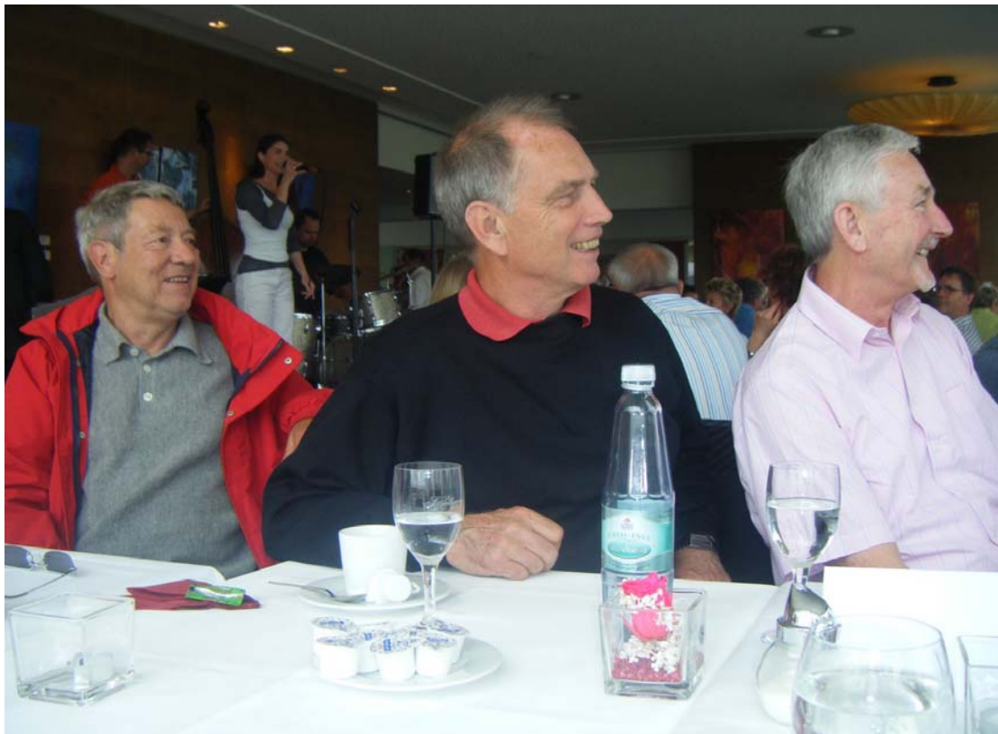
Wo ist denn der Jazz in Pommersfelden?