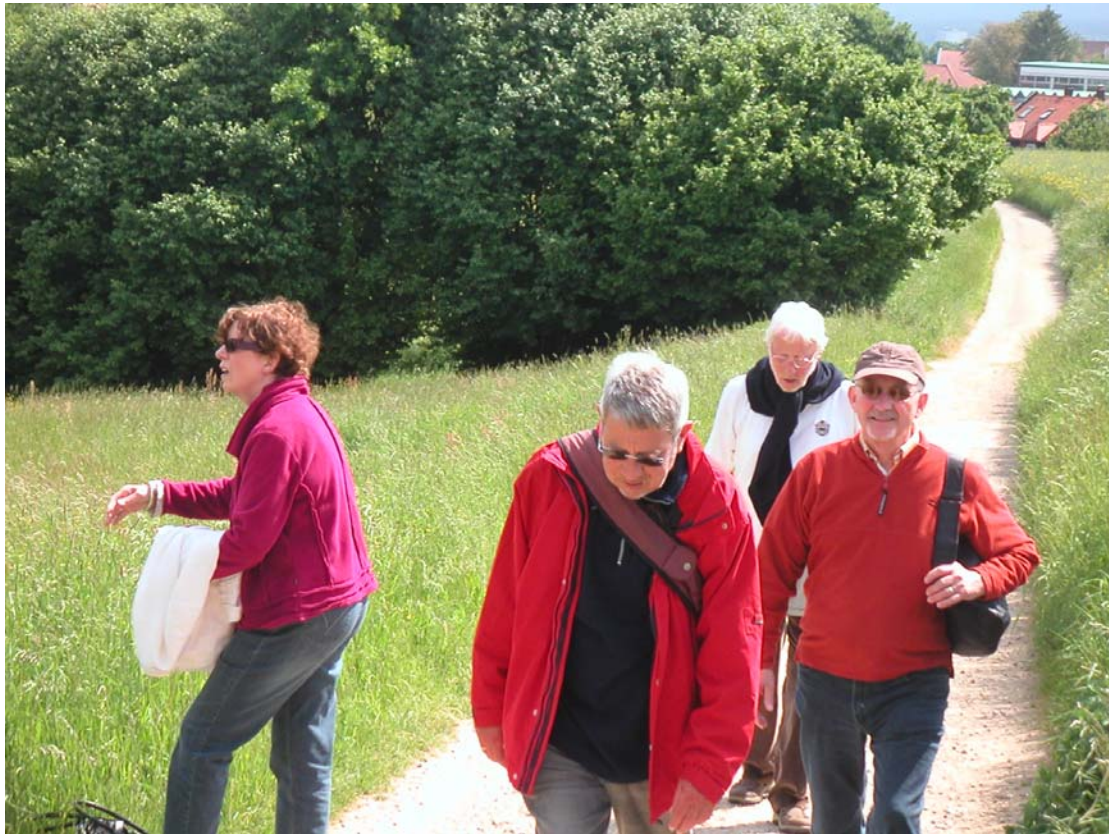
Wie lange noch?