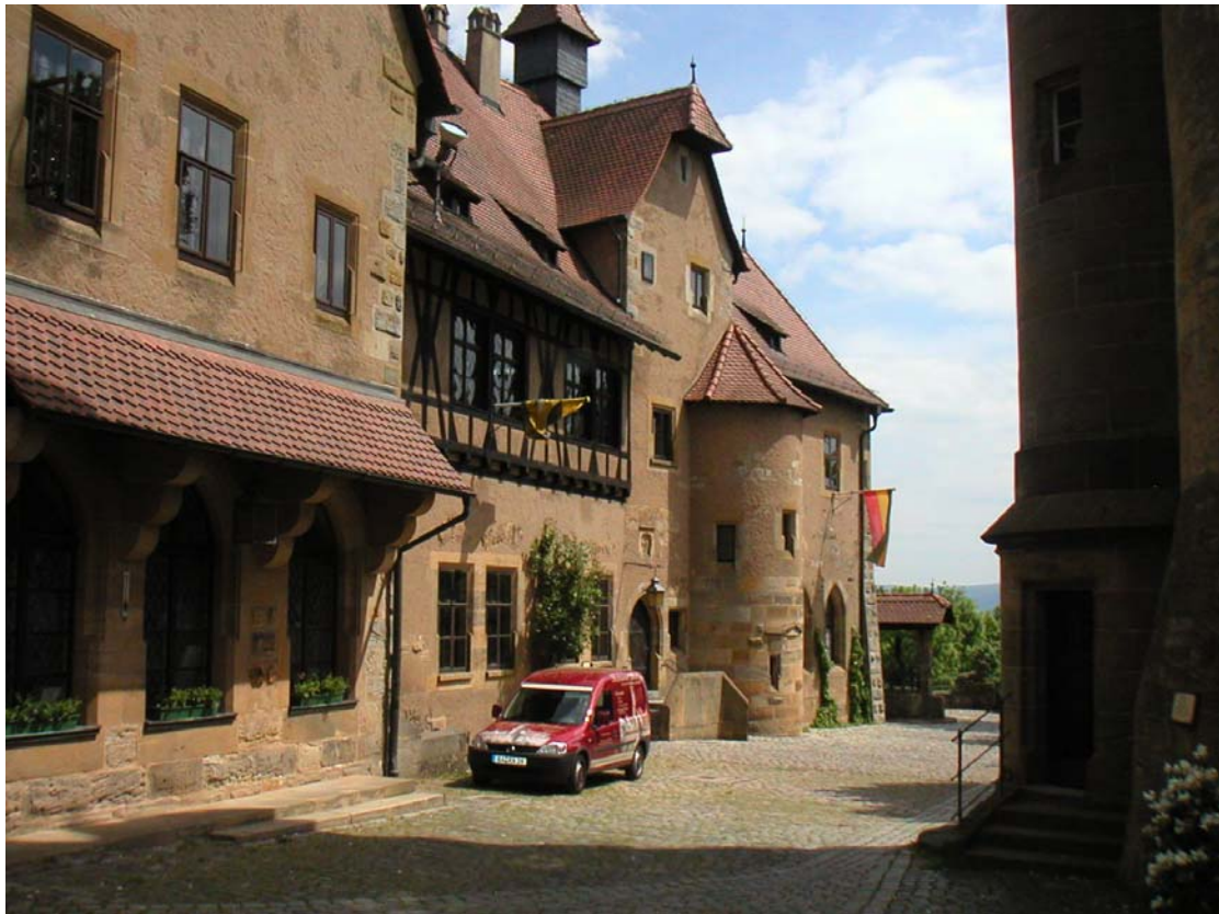
Mit dem Auto geht es einfacher