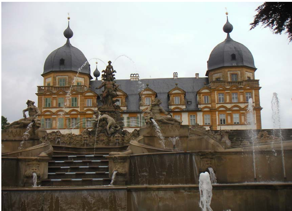
Die Kaskade von Schloss Seehof