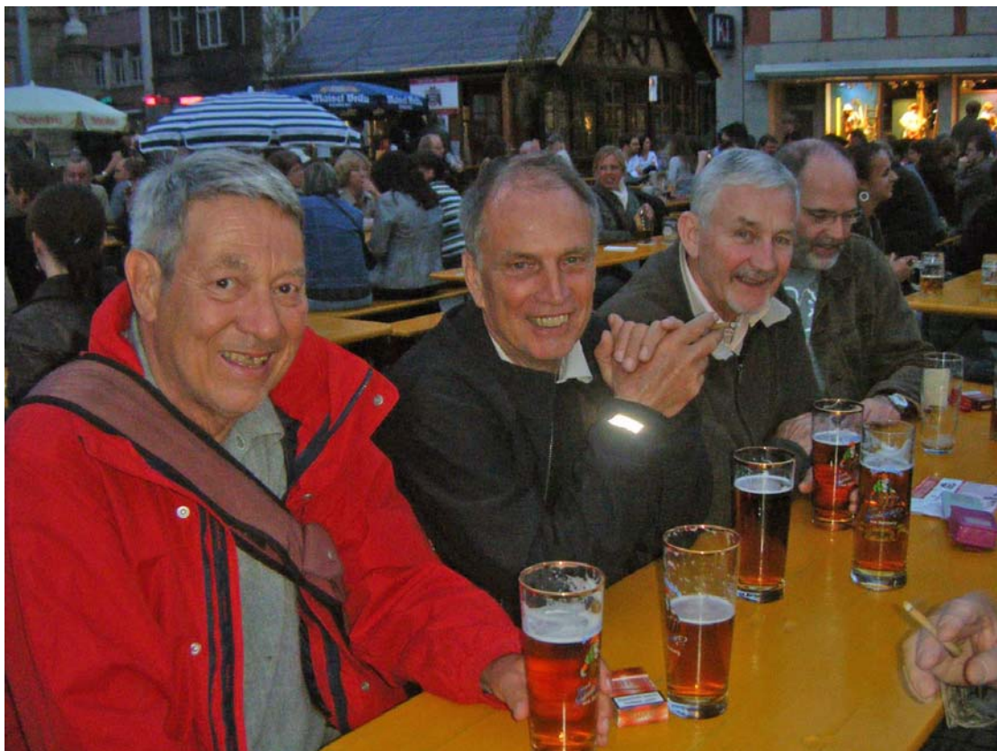
Bierfest am Neuen Rathaus