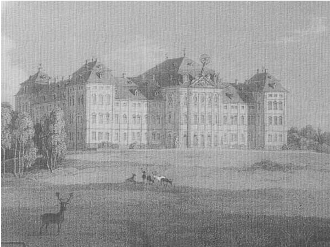
Stich: Schloss Seehof bei Memmelsdorf