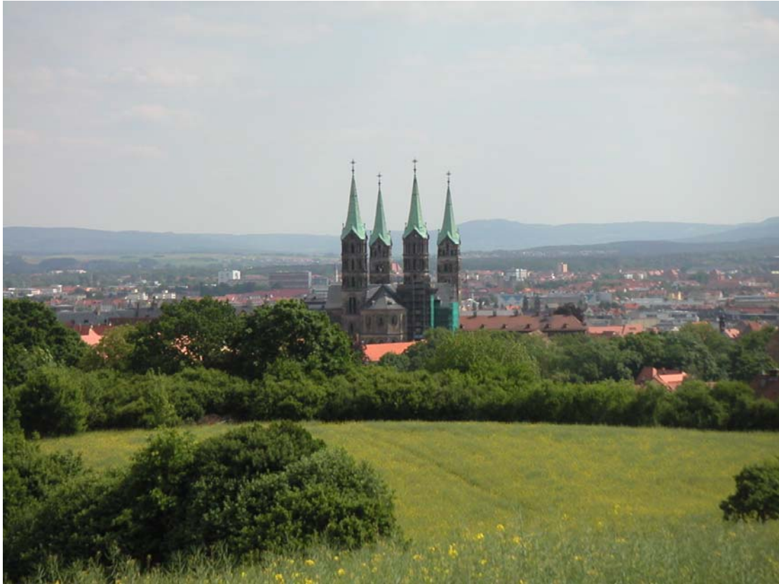
Blick auf Bamberg

Besuch der Altenburg. Mit Regionalzug und ICE zurück nach Hamburg