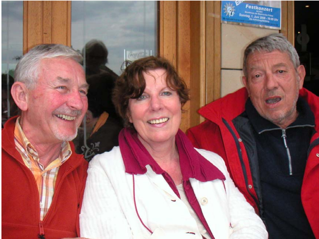
Am Alten Rathaus beim Cappucino