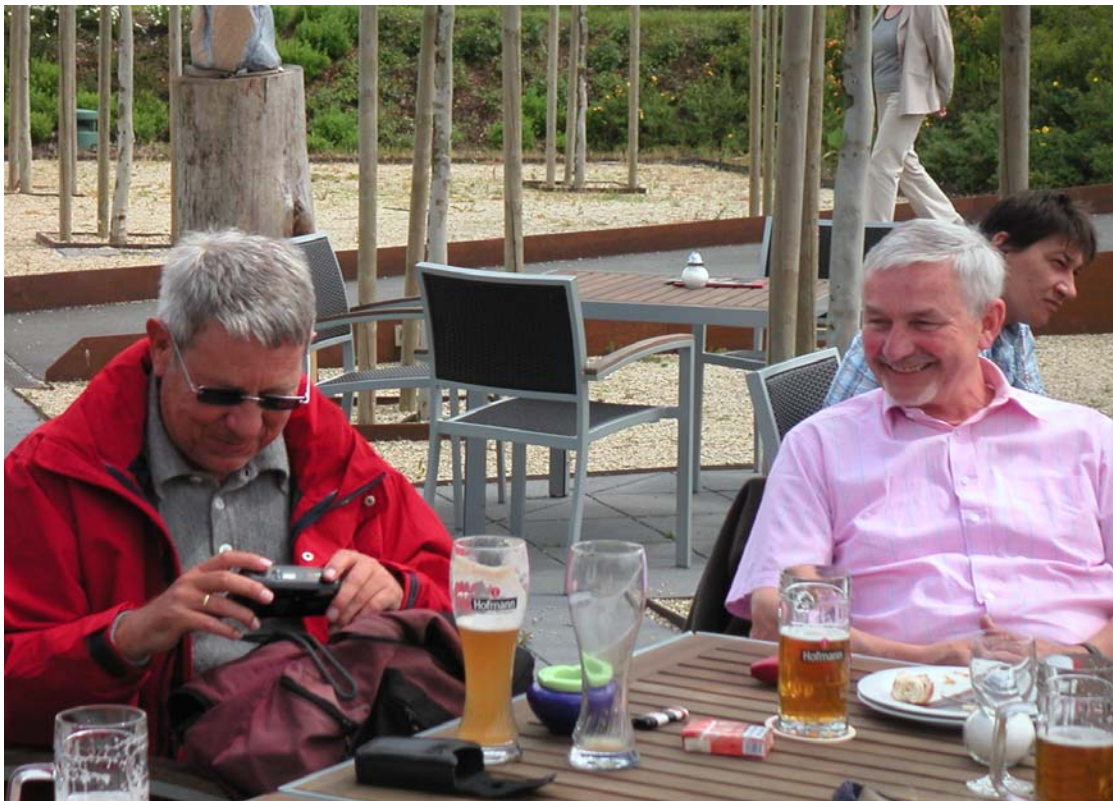
Nur einer hält an der klassischen Kamera fest