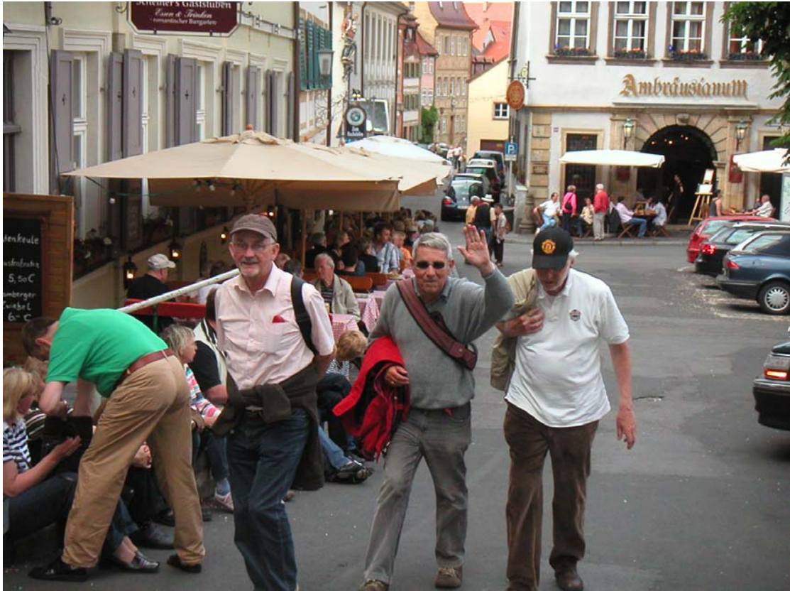
Der MZIG auf dem Wege zum Rauchbier