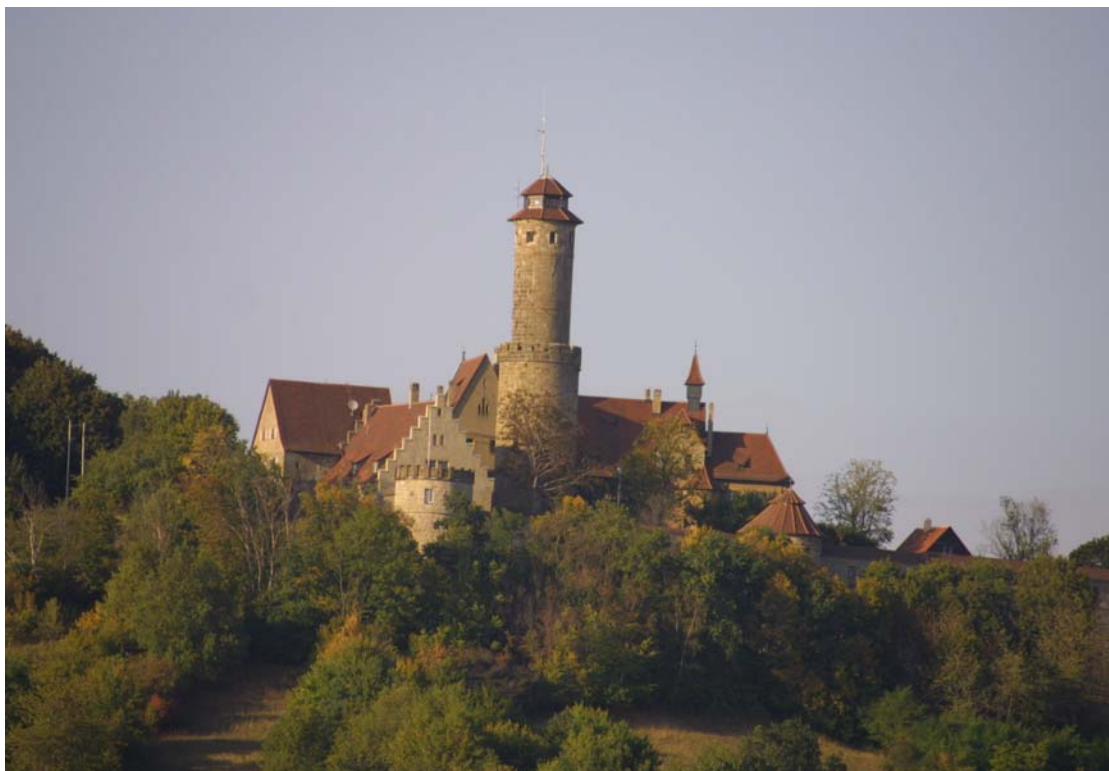
Die Altenburg. Erreichbar?