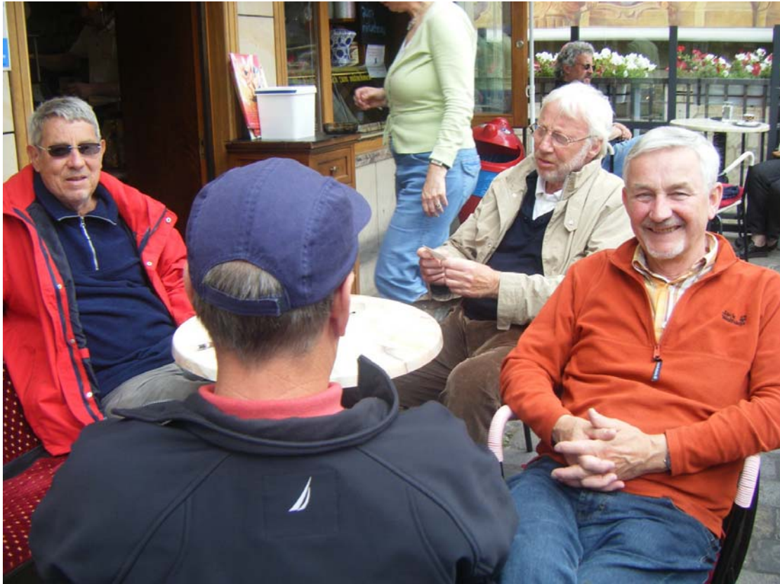
Zurück beim Alten Rathaus und