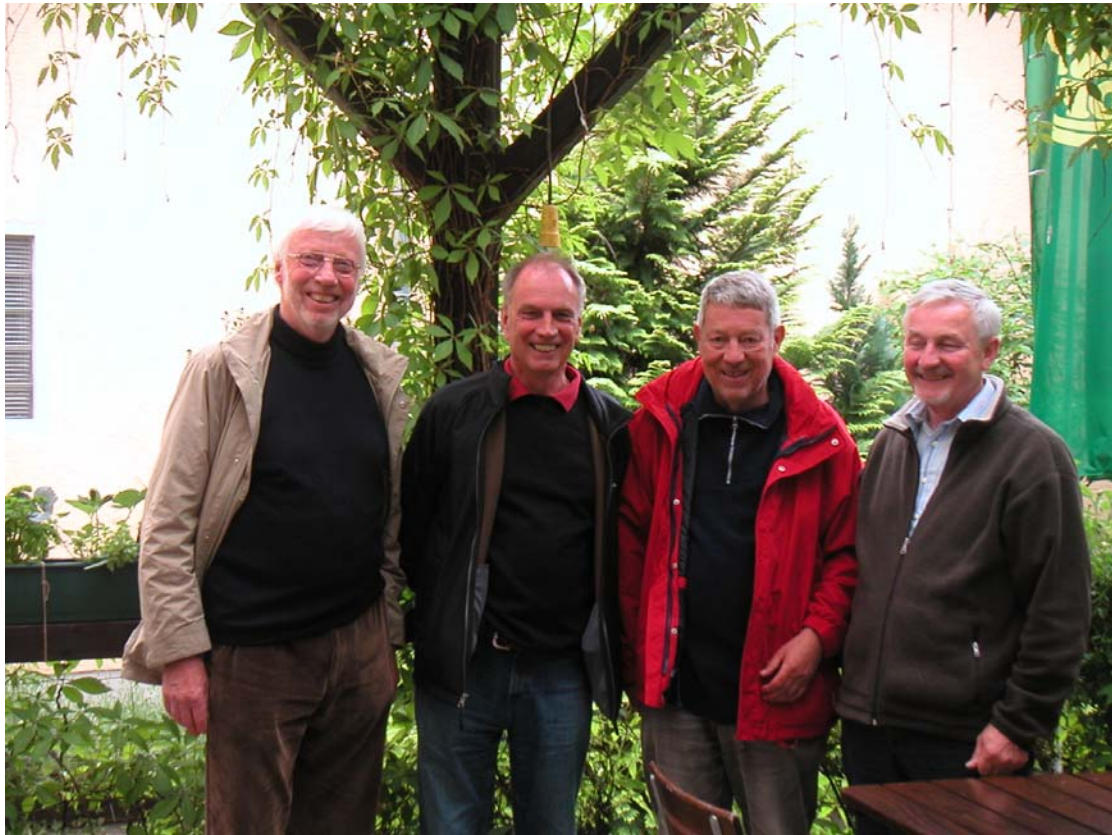
Im Gasthof in Memmelsdorf

Busfahrt nach Memmelsdorf, Auf den Spuren der MZIG Reise 1992, Schloss Seehof