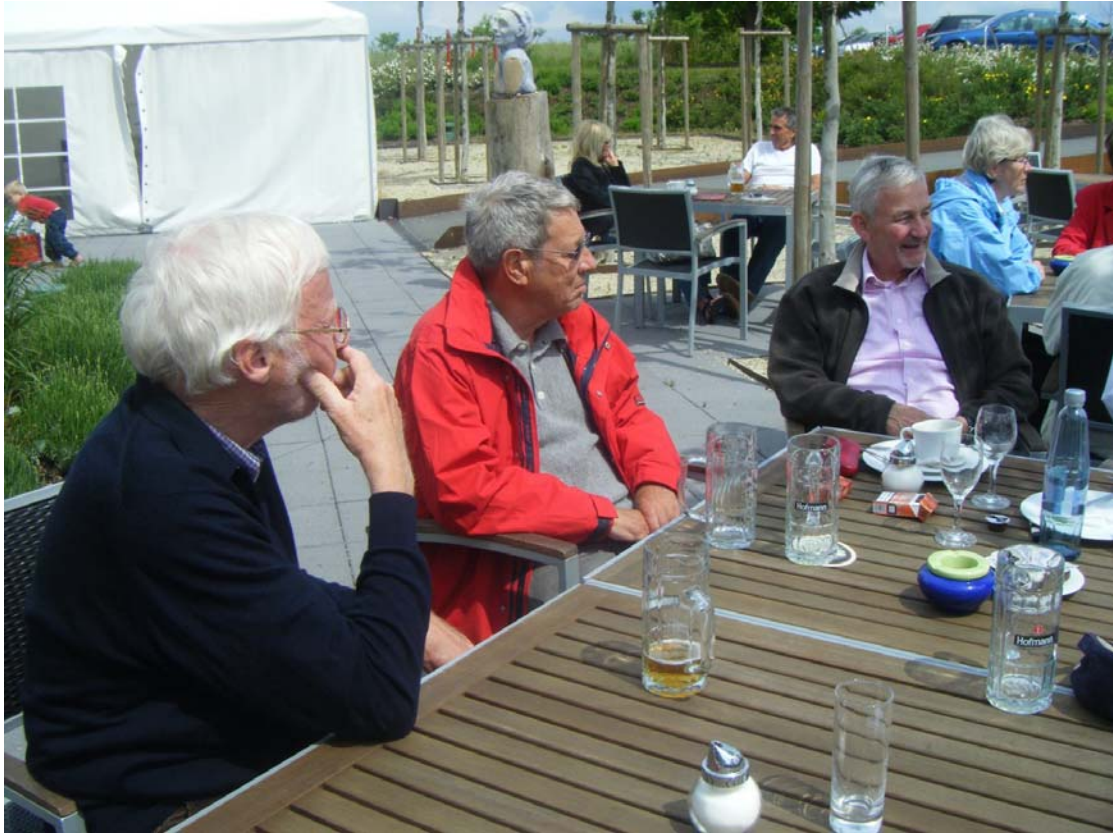
Die Sonne kommt zurück