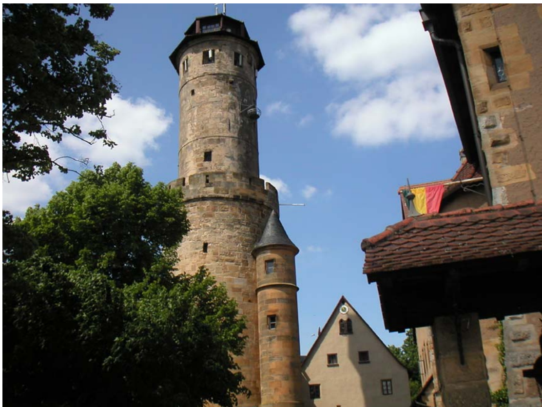
Die Generalversammlung des MZIG im Schloss erreichte nicht das notwendige Quorum!