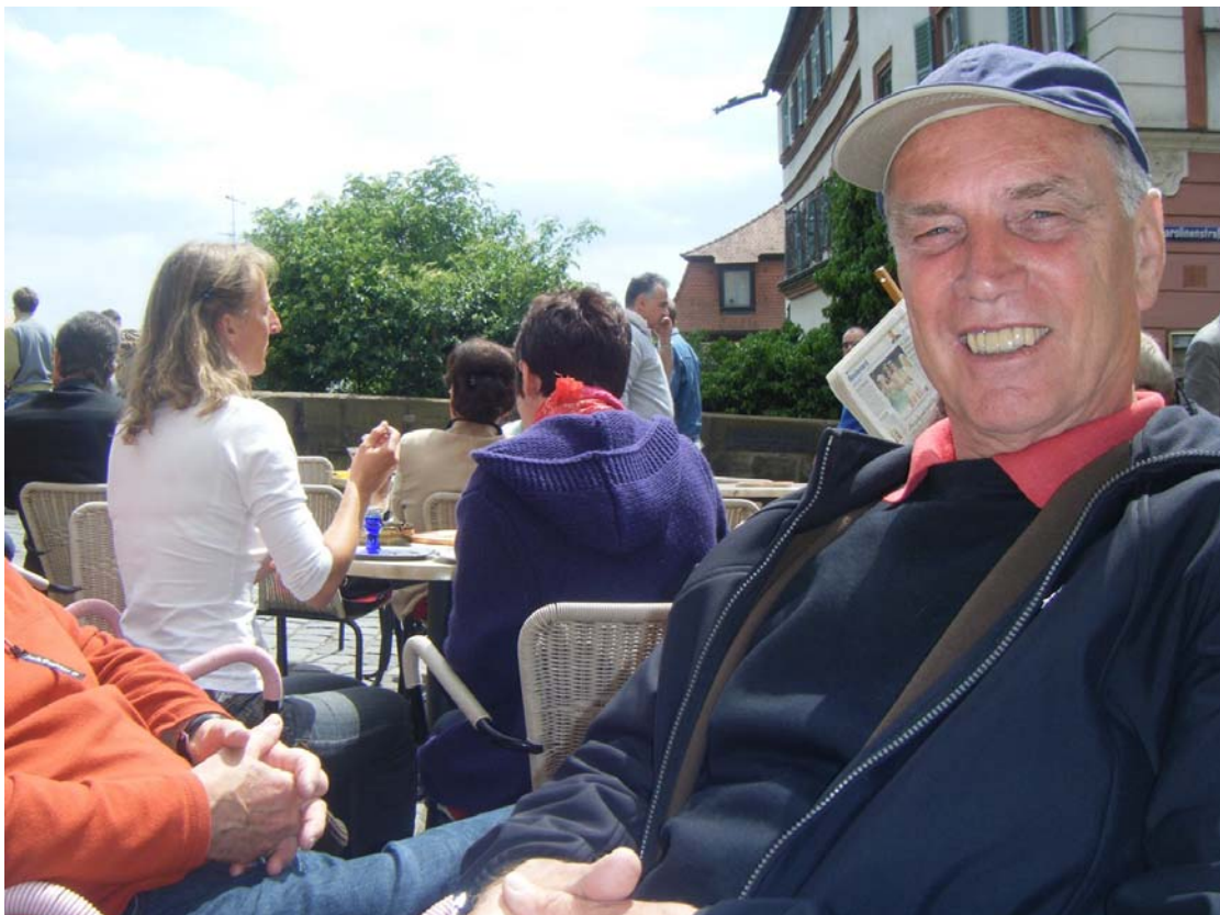
die Sonne lacht!