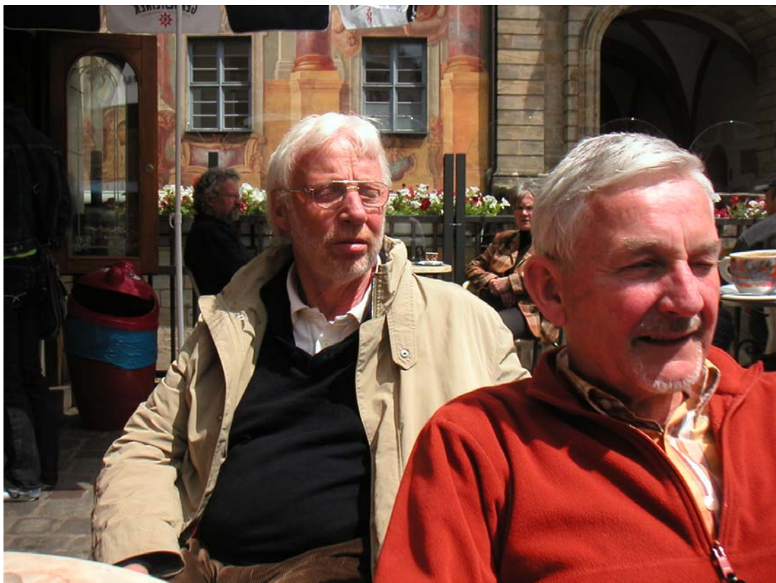
Am Alten Rathaus