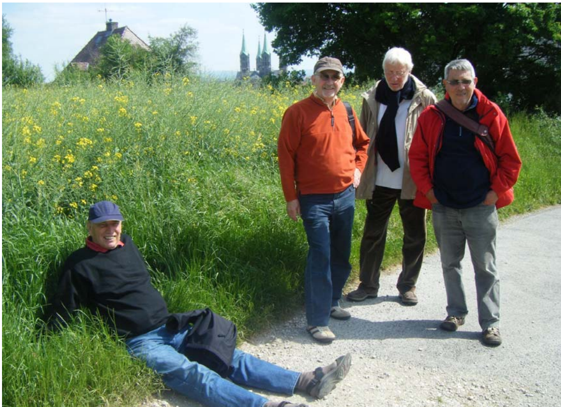
Es gibt die ersten Ausfälle