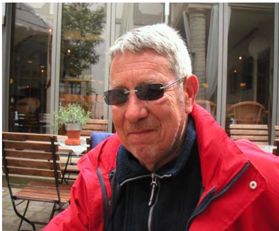
Zurück in Bamberg