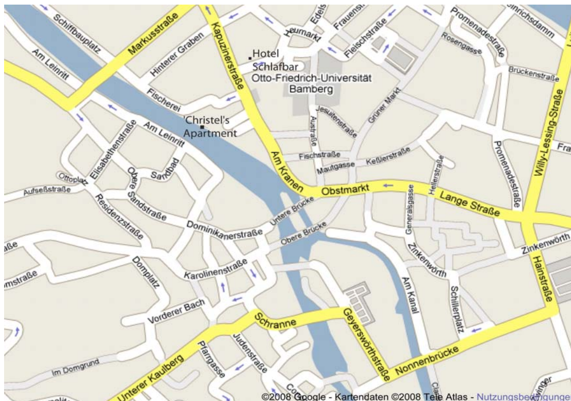
Altstadt von Bamberg,