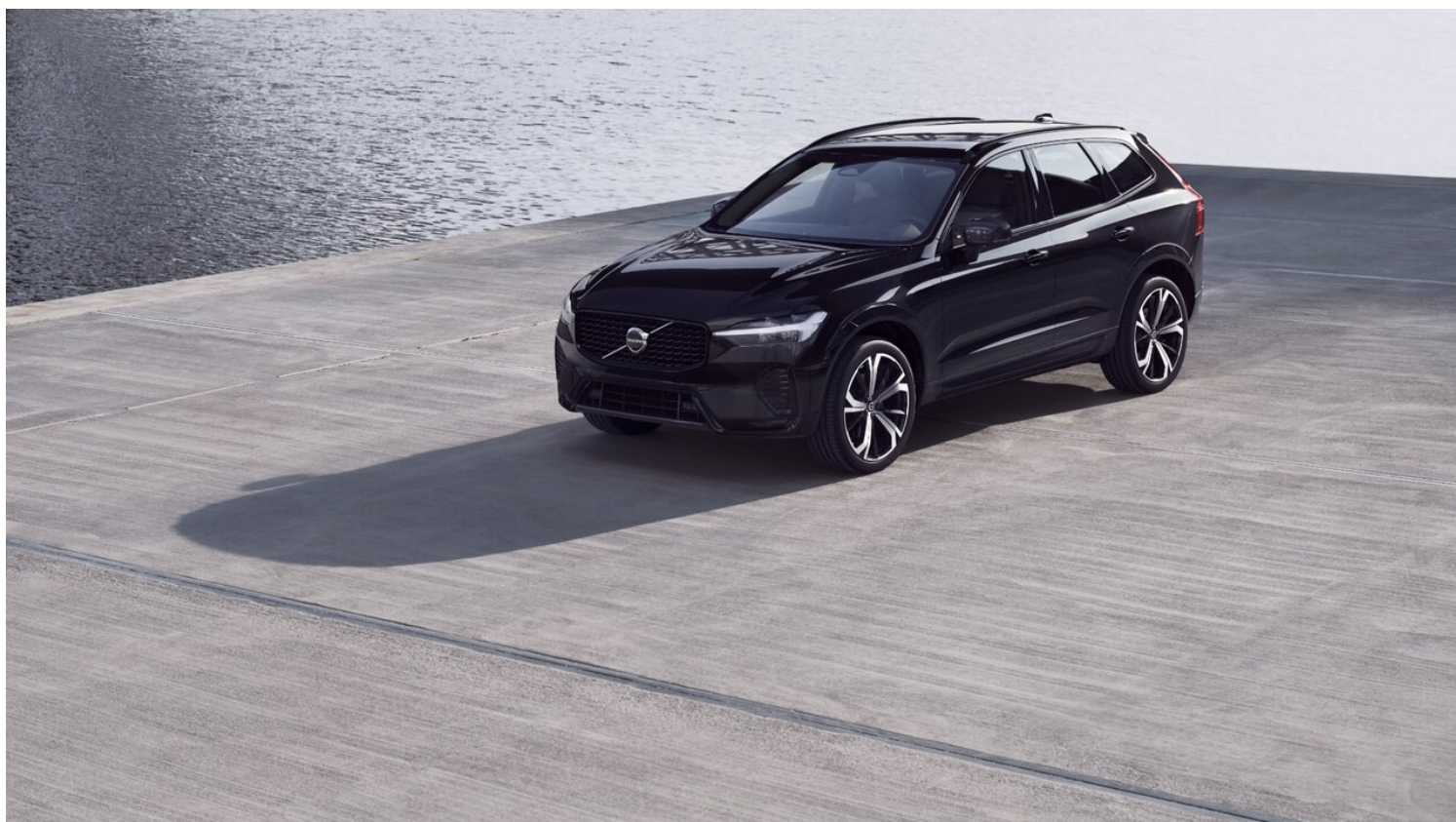
XC60 Dark Plus Wygląd zewnętrzny

Link do wersji: s.volvocars.com/MjGoHfZMtaCkwBtT