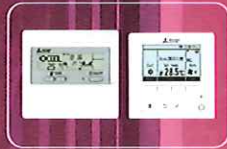
อุปกรณ์เสริม

Inverter Series Mr. SLIM R32 ระบบอินเวอร์เตอร์