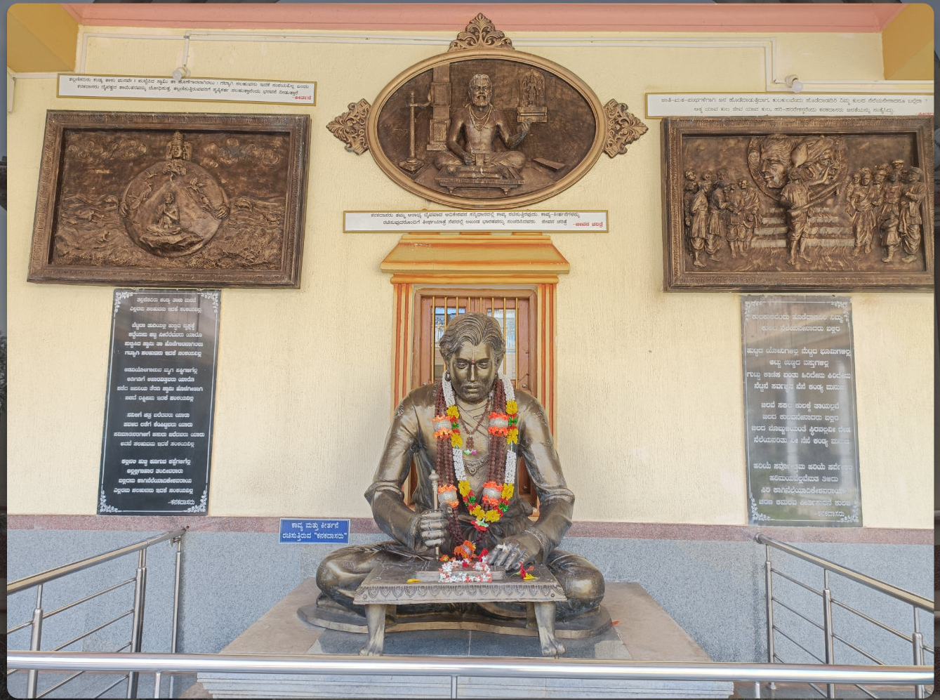
ಕನಕದಾಸರು ಹಾವೇರಿ ಜಿಲ್ಲೆಯ ಶಿಗ್ಗಾವಿ ತಾಲೂಕಿನ ಬಾಡ ಗ್ರಾಮದಲ್ಲಿ 1509ರಲ್ಲಿ ಜನಿಸಿದರು.

ಹಾವೇರಿ ಜಿಲ್ಲೆ ಶಿಗಾವ್ ತಾಲೂಕಿನ ಬಾಡ ಗ್ರಾಮದಲ್ಲಿ ನಾಲ್ಕು ಎಕರೆ ಪ್ರದೇಶದಲ್ಲಿ ಮರುಸ್ಥಾಪಿಸಲಾದ ಕೋಟೆ ಇದು.