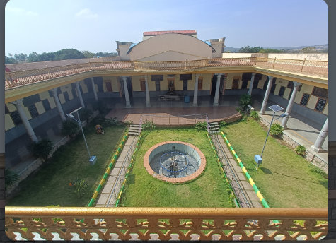
ಕನಕದಾಸರು ಕನ್ನಡ ಸಾಹಿತ್ಯ ಲೋಕಕ್ಕೆ ಸಾಹಿತ್ಯದ ಹಲವು ಪ್ರಕಾರಗಳಾದ ಕೀರ್ತನೆಗಳು, ಸುಳಾದಿಗಳು, ಉಗಾಭೋಗಗಳ ಕೊಡುಗೆ ನೀಡಿದ್ದಾರೆ.