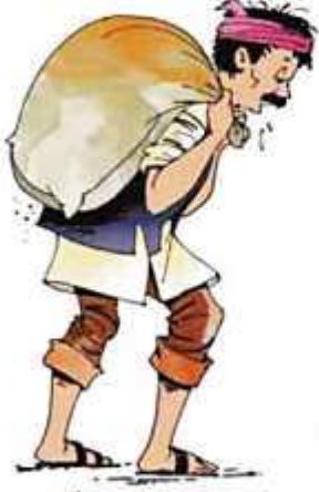
कुंभारमामा आधी चांगली माती मिळवतात.

माठ तयार करताना ते काय काय करतात, हे तुम्ही पाहिले आहे का? सोबतची चित्रे पहा.