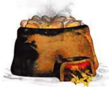
कच्चे माठ भाजून पक्के केले जातात.