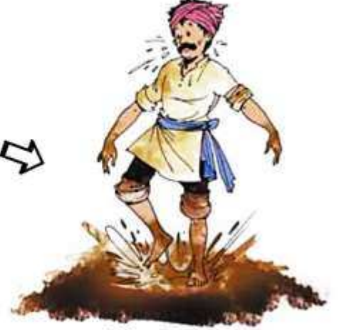
त्यात पाणी मिसळून चिखल करतात. याला माती मळणे असे म्हणतात.