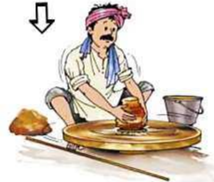
ही मळलेली माती चाकावर फिरवून त्यापासून माठ तयार करतात.

माठ बनवण्याच्या उद्योगात, कच्चा माल आहे - माती. पक्का माल आहे - माठ. माती या कच्च्या मालापासून माठ हा पक्का माल तयार करण्यासाठी जे काही केले, ती आहे प्रक्रिया. ही प्रक्रिया म्हणजेच उद्योग.