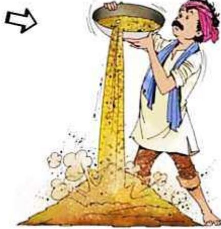
माठ चांगले बनावेत, म्हणून मातीत इतर काही पदार्थ मिसळतात.