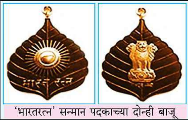
'भारतरत्न' सन्मान पदकाच्या दोन्ही बाजू

'भारतरत्न' हा भारताचा सर्वोच्च नागरी सन्मान आहे. हा सन्मान राष्ट्रीय सेवेसाठी दिला जातो. या राष्ट्रीय सेवांमध्ये कला, साहित्य, विज्ञान, सार्वजनिक सेवा आणि क्रीडा यांचा समावेश आहे. या सन्मानाचा प्रारंभ २ जानेवारी १९५४ रोजी भारताचे तत्कालीन राष्ट्रपती डॉ. राजेंद्रप्रसाद यांच्या काळात केला गेला.