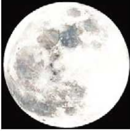
पौर्णिमेच्या दिवशी दिसणारे चंद्राचे स्वरूप

सूर्यमालेत बहुतेक ग्रहांना उपग्रह आहेत. ग्रह आपापल्या उपग्रहांसह सूर्याभोवती परिभ्रमण करतात.