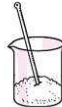
बर्फाचा चुरा व मीठ