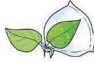
२.९ : वनस्पतीच्या पानावरील उत्सर्ग