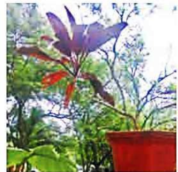
A potted plant