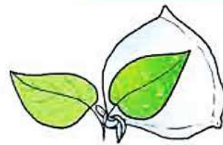
2.9 : Excretion on the leaves of a plant