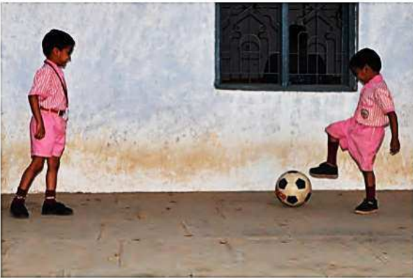
चेंडू पायाने ढकलत नेताना