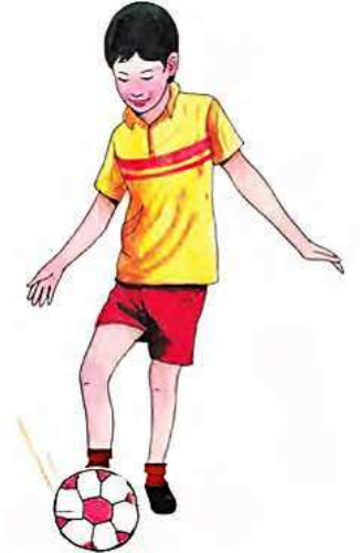
चेंडू पायाने जोरात मारणे