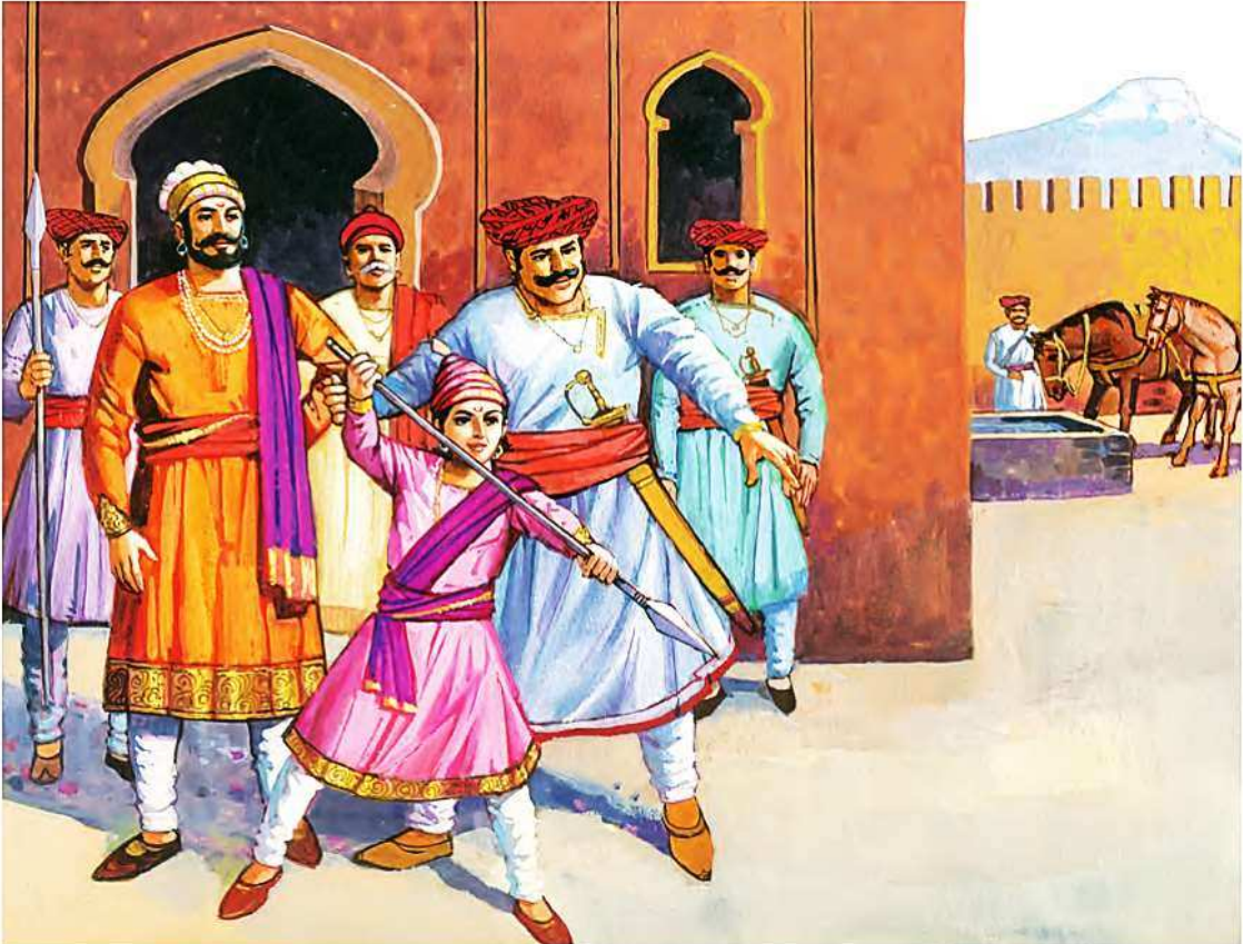
शहाजीराजांच्या देखरेखीखाली शिवरायांचे शिक्षण

लवकरच आदिलशाहाने शहाजीराजांना कर्नाटकातील नायकांची राज्ये जिंकण्याच्या मोहिमेवर पाठवले. या मोहिमेवर जाण्यापूर्वी शहाजीराजांनी जिजाऊ व शिवराय यांची पुणे जहागिरीकडे रवानगी केली. त्या वेळी त्यांच्याबरोबर शहाजीराजांनी हत्ती, घोडे, पायदळ, खजिना, ध्वज, तसेच विश्वासू प्रधान, शूर सेनानी आणि विख्यात शिक्षक यांना धाडले.