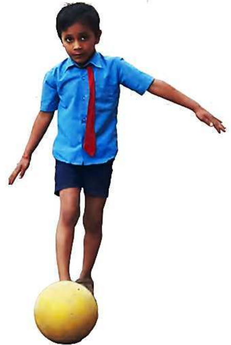
चेंडू ढकलत नेणे