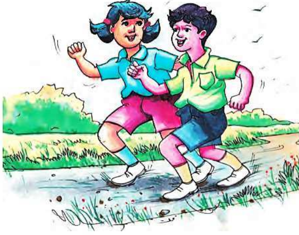
जलद चालणे शर्यत