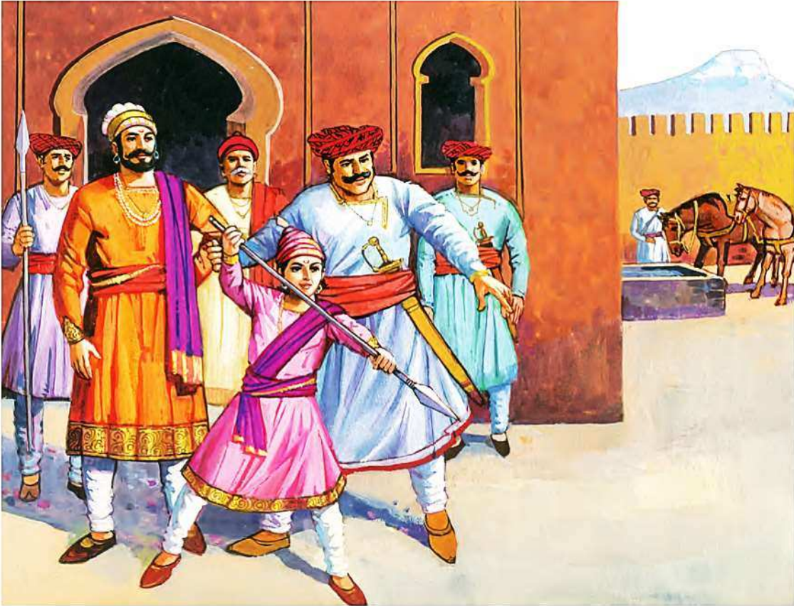
शहाजीराजांच्या देखरेखीखाली शिवरायांचे शिक्षण

लवकरच आदिलशाहाने शहाजीराजांना कर्नाटकातील नायकांची राज्ये जिंकण्याच्या मोहिमेवर पाठवले. या मोहिमेवर जाण्यापूर्वी शहाजीराजांनी जिजाऊ व शिवराय यांची पुणे जहागिरीकडे रवानगी केली. त्या वेळी त्यांच्याबरोबर शहाजीराजांनी हत्ती, घोडे, पायदळ, खजिना, ध्वज, तसेच विश्वासू प्रधान, शूर सेनानी आणि विख्यात शिक्षक यांना धाडले.