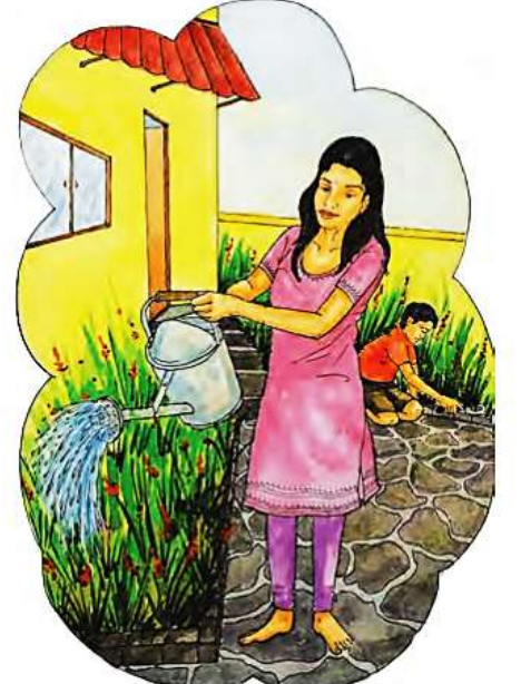
परसबाग, फुलझाडे यांच्यासाठी