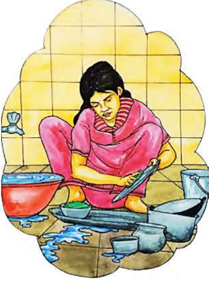
कपडे, भांडी यांच्या स्वच्छतेसाठी

पाण्याचा घरगुती वापर पाण्याचा घरगुती वापर पुढीलप्रमाणे केला जातो.