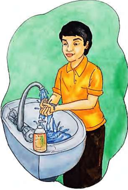
हात स्वच्छ धुण्यासाठी