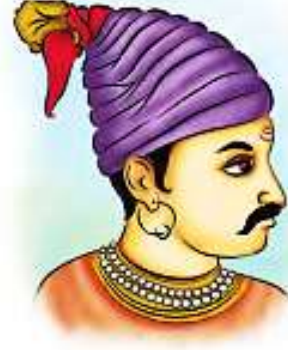
छत्रपती राजाराम महाराज

संभाजी महाराजांचा मृत्यू : औरंगजेब संभाजी महाराजांना नमवण्यासाठी प्रयत्नांची पराकाष्ठा करत होता. त्याने मुकर्रबखान याची नेमणूक कोल्हापूर प्रांतावर केली होती. महाराज कोकणातील संगमेश्वर येथे असल्याची बातमी मुकर्रबखानास कळली. तेव्हा त्याने छापा घालून संभाजी महाराजांना पकडले. बादशाहापुढे नेण्यात आल्यानंतर त्याच्यापुढे ते अतिशय बाणेदारपणे वागले. मग बादशाहाच्या हुकमाने ११ मार्च १६८९ रोजी अत्यंत अमानुषपणे त्यांना ठार करण्यात आले. मराठ्यांचा हा छत्रपती स्वाभिमान न सोडता अत्यंत धीरोदात्तपणे मृत्यूला सामोरा गेला. त्यांच्या बलिदानापासून प्रेरणा घेऊन मराठ्यांनी मुघलांविरुद्धचा संघर्ष अधिकच तीव्र केला.