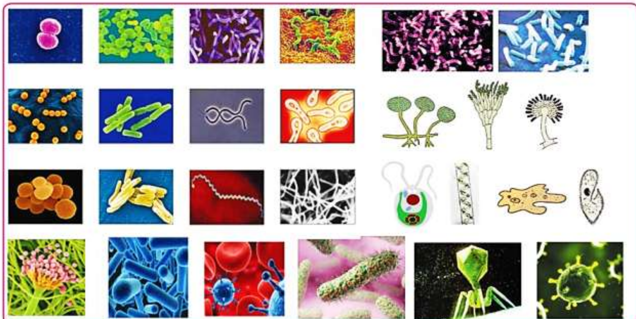
11.7 A variety of microbes

Among the sketches you have drawn, do you find any of the micro-organisms you see below? What inferences can you draw about their sizes?